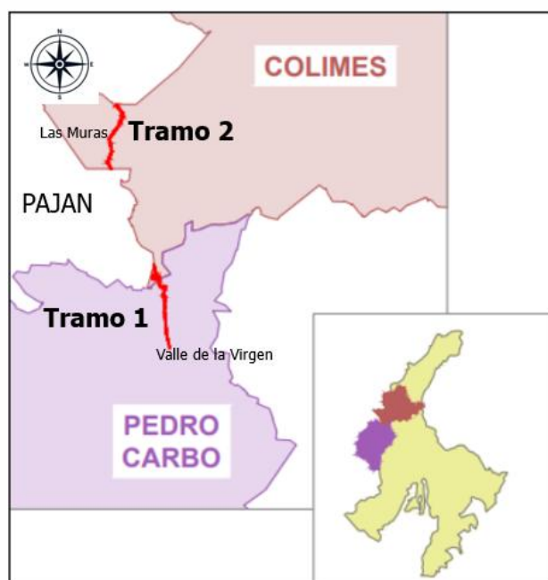
Figura 1. Ubicación del Proyecto.

Vía: Vía Valle de la Virgen – Lím. Provincial y Lím. Provincial – Las Muras – Lím. Provincial Cantón: Pedro Carbo y Colimes Longitud aprox.: 12.88 Km Ancho prom.: Tramo Llano 9.00 m., Tramo Montañoso 7.00 m., Tramo Ondulado 8.00 m.