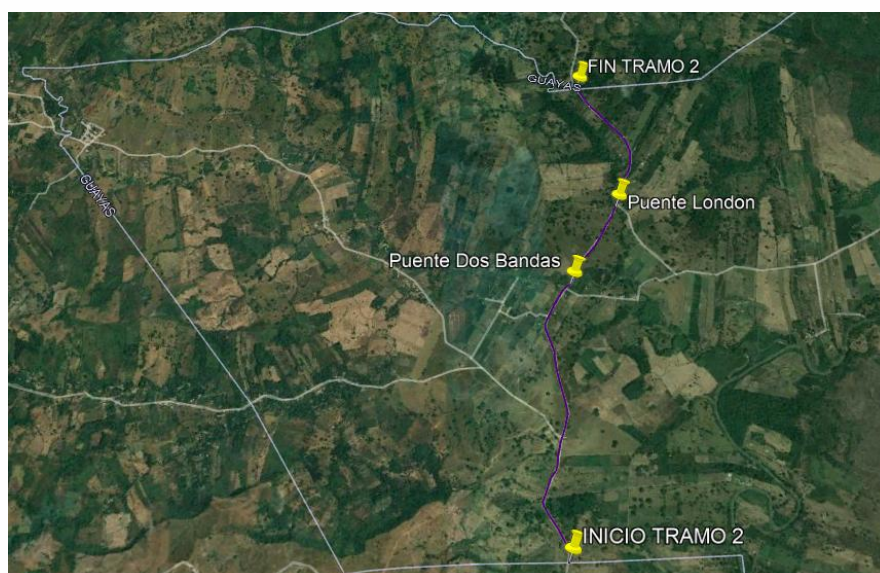
Figura 3. Ubicación del Tramo 2.